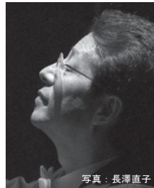
佐々木 修 指揮[23日]