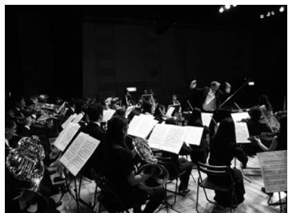
海外音楽大学マスタークラスの様子