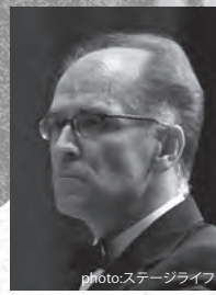
クリスティアン・ハンマー 指揮(A/B/C)