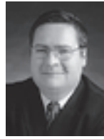
演出 シュテフェン・ピオンテック