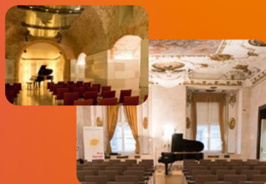
ウィーン公演会場イメージ

入賞・入選者には東京国際芸術協会が推薦するオーストリア国ウィーン市内で開催する「コンクール入賞者によるウィーン公演」への出演権利を進呈致します!